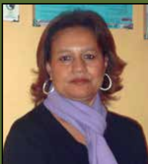
Lilia Mayorga Balcazar Área de Imagen Institucional

El tema afroperuano, el racismo, la discriminación, la invisibilidad, la identidad, la autoestima, los derechos humanos, los estereotipos, la pobreza, la niñez, la adolescencia, etcétera, han sido palabras de todos los días en los quince años de CEDET. Palabras que se convirtieron en temas y estos nos llevaron a proponer varios proyectos y a realizar muchas actividades, con el solo objetivo de contribuir al cambio y lograr una sociedad más inclusiva.